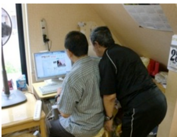
ともに学ぶパソコン操作