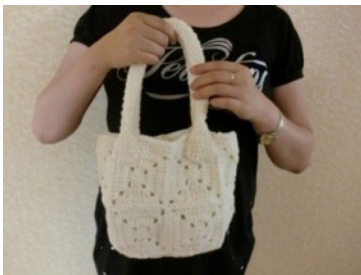
売れる時を目指して