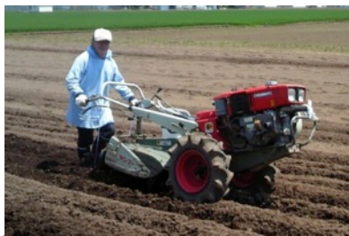
農作業 耕うん機を体験