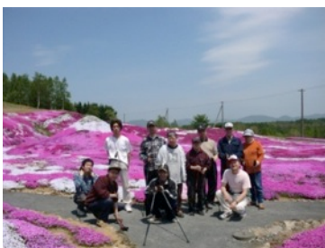
ウォーキングで体力作り