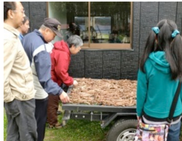
「冒険家族」職場見学