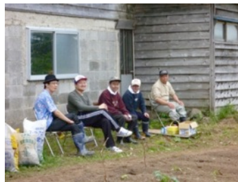
農作業 ちょっと休憩…