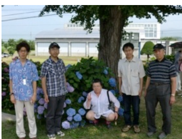
「あじさい寺」で納涼